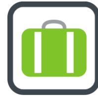
Figuur 10: Top 5 toerismebranche.