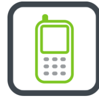
Figuur 4: Top 5 telecombranche.