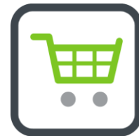
Figuur 5: Top 5 detailhandel.