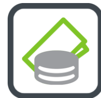
Figuur 6: Top 5 financiële dienstverleners.